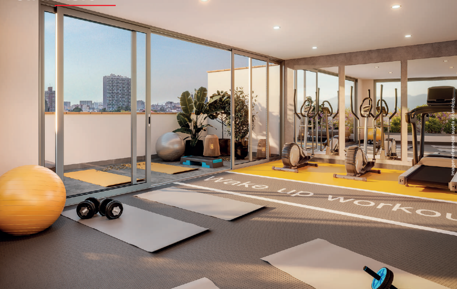
Imagen referencial sujeta a cambios.