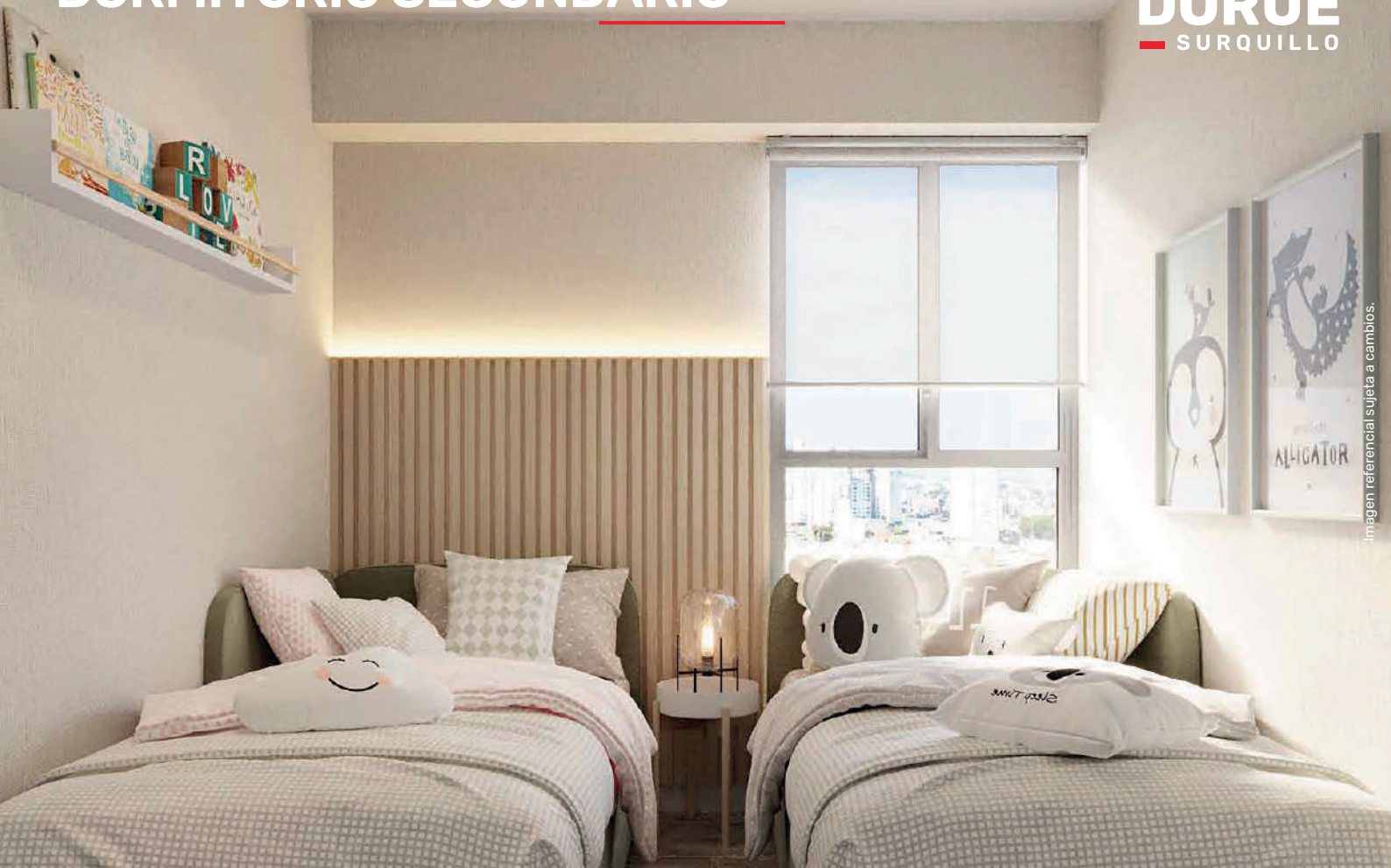
Imagen referencial sujeta a cambios.