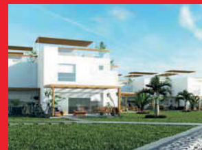
Kalani - 2020