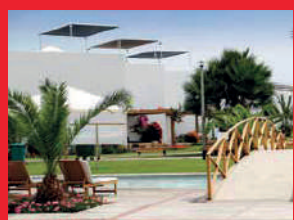
Asia del Mar - 2006