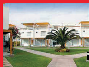
Asia del Sur - 2009