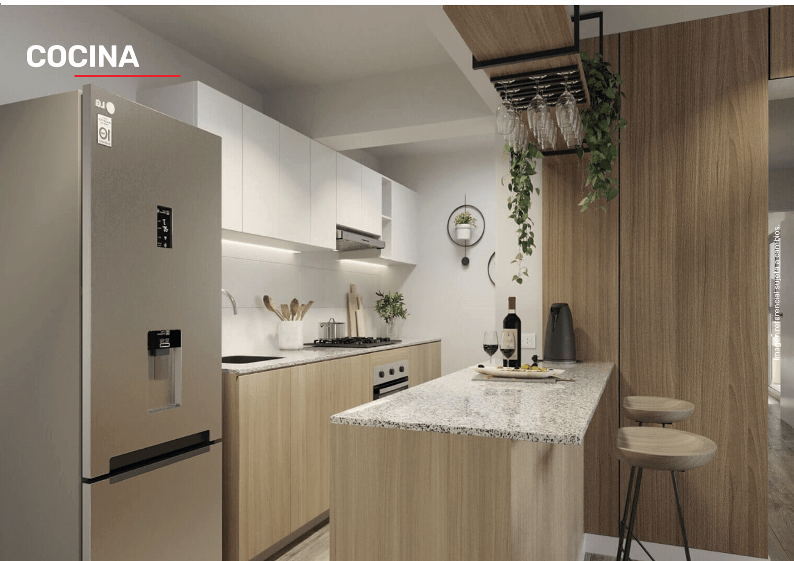
Imagen referencial sujeta a cambios.