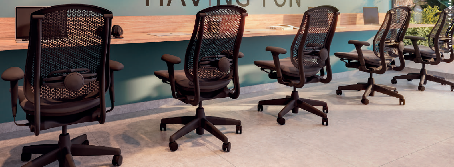
Imagen referencial sujeta a cambios.