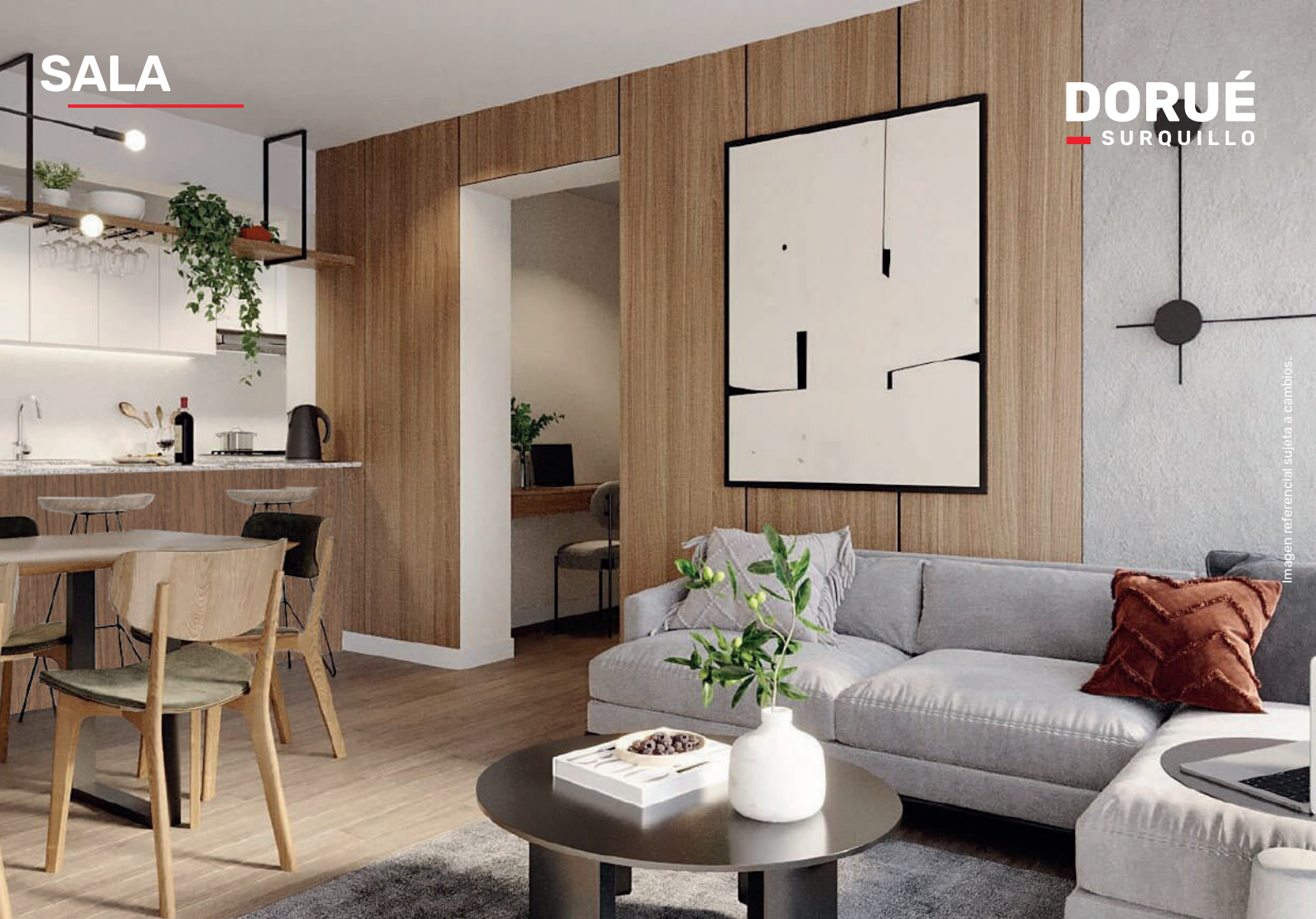
Imagen referencial sujeta a cambios.