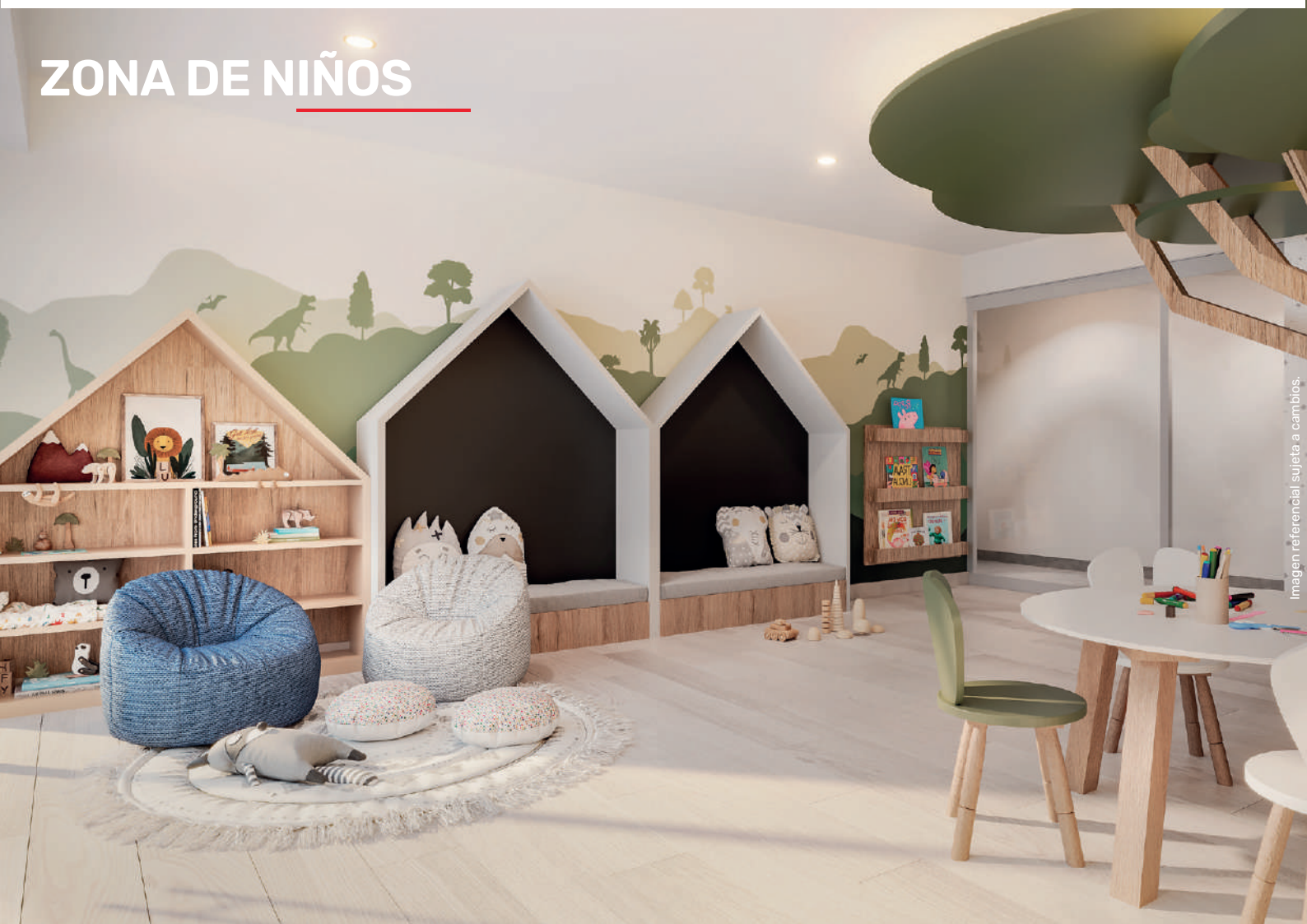
Imagen referencial sujeta a cambios.