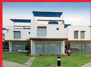
Asia Azul - 2010