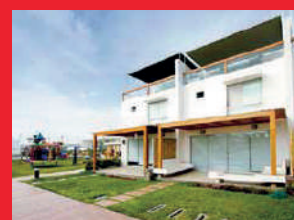
Asia del Sol - 2009