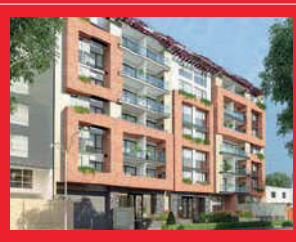
Lord Nelson - 2020