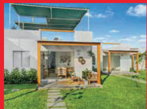
Kala - 2022