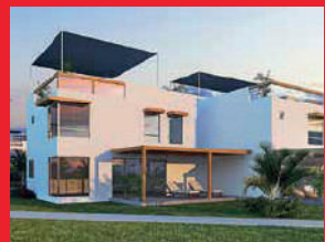
Kentia - 2019