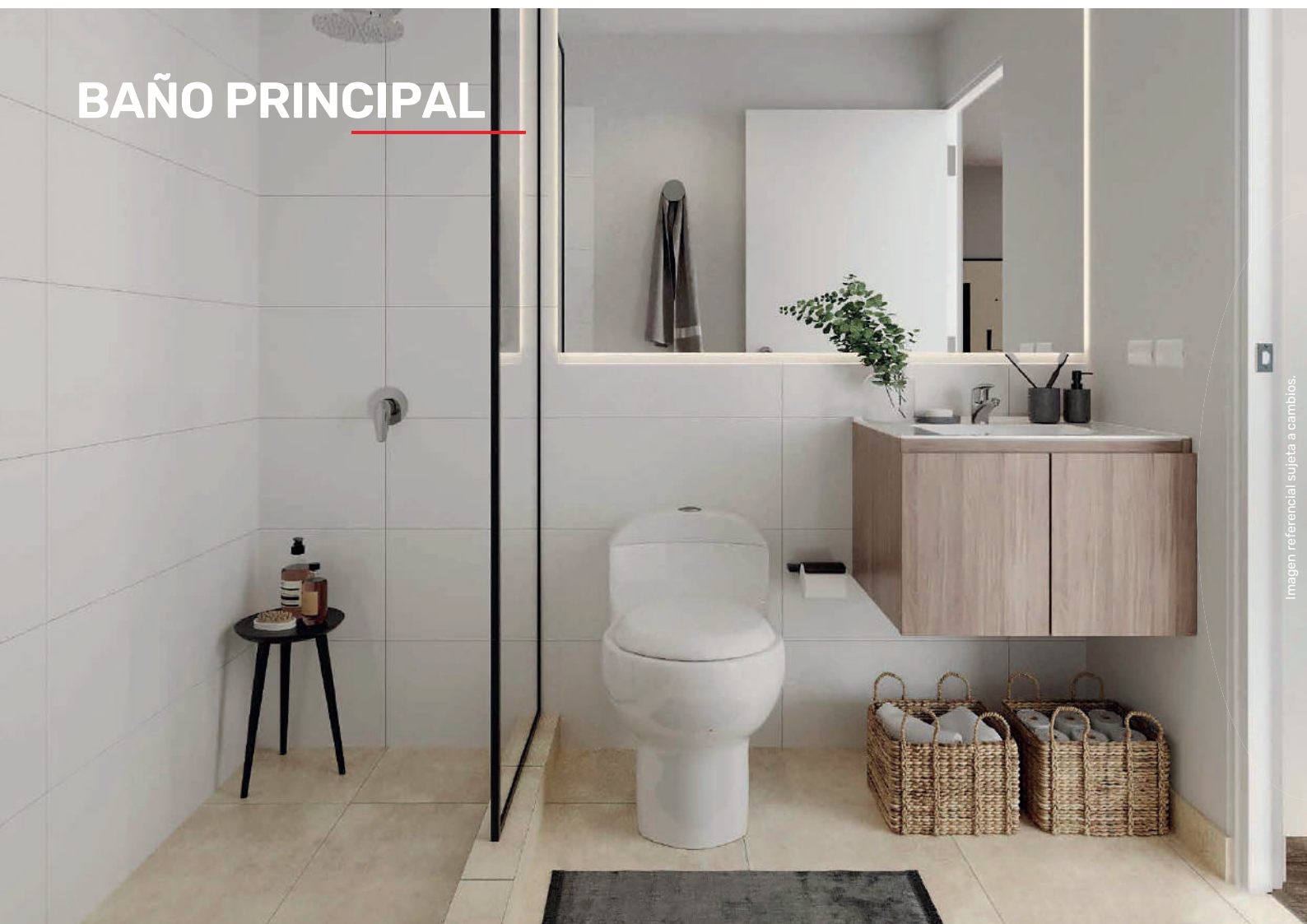
Imagen referencial sujeta a cambios.