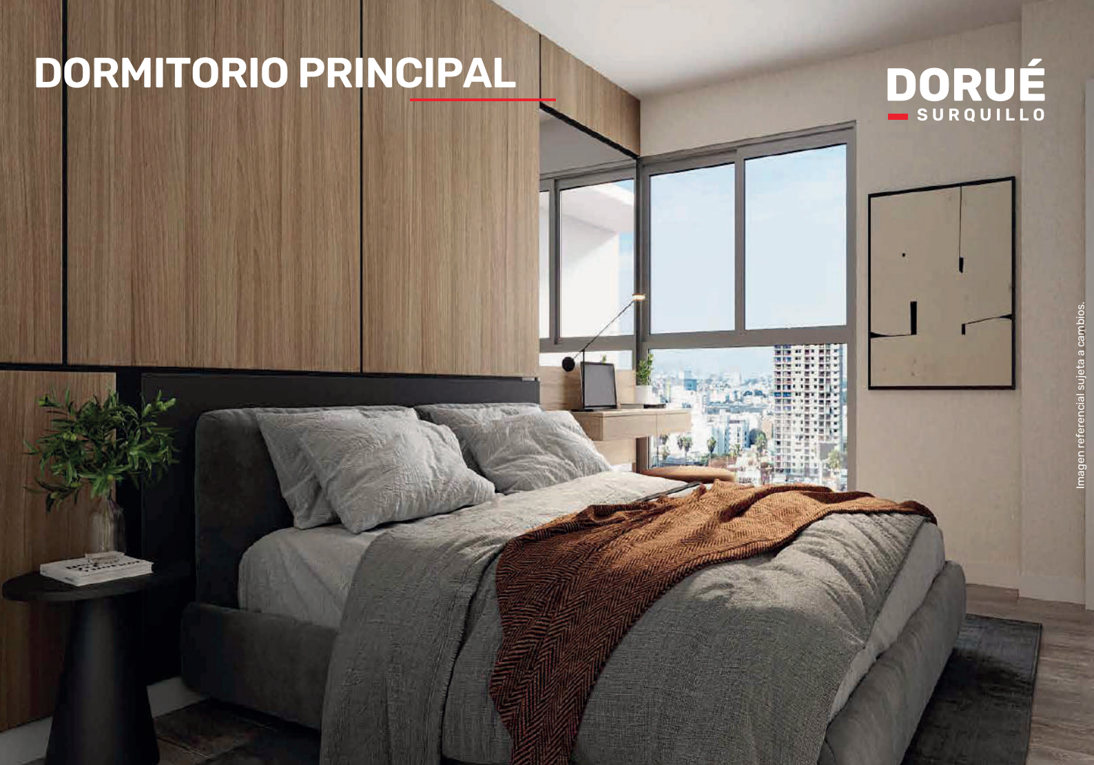
Imagen referencial sujeta a cambios.