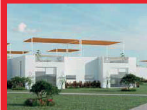
Kalúa - 2021